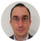
Guillaume CREPIN , délégué IDF de l'Agence Nationale de la Sécurité des Systèmes d'Information (ANSSI)